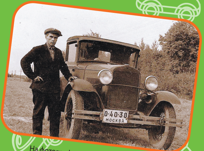
На фотографиях машина Газ-А